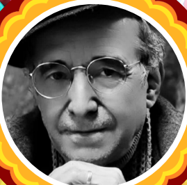
منصور خلیج پیشگسوت تئاتر