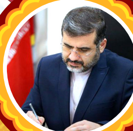
محمد مهدی اسماعیلی وزیر فرهنگ و ارشاد اسلامی