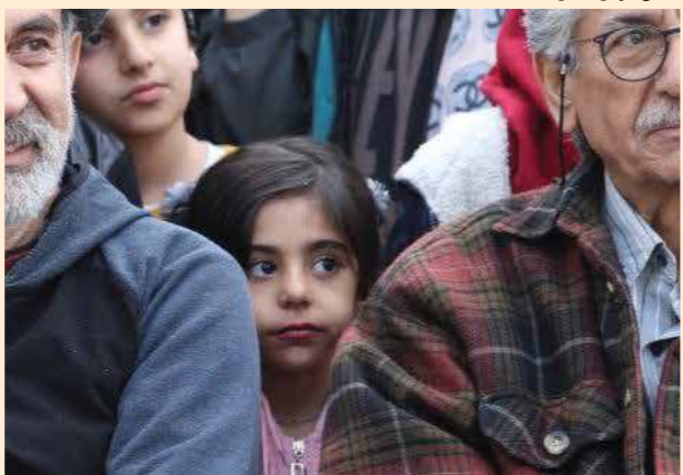
نگاه کودکان در ادامه مسیر راه بزرگان نمایش کودک