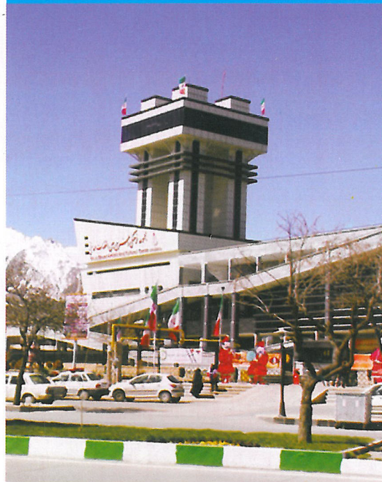
در جایی که خاکسترش را بر باد دادند ساخت مجموعه فرمینگن عین القضاات