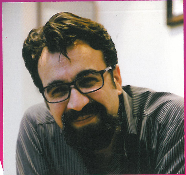
گفت و گو با عظیمی طراح پوستر جشنواره